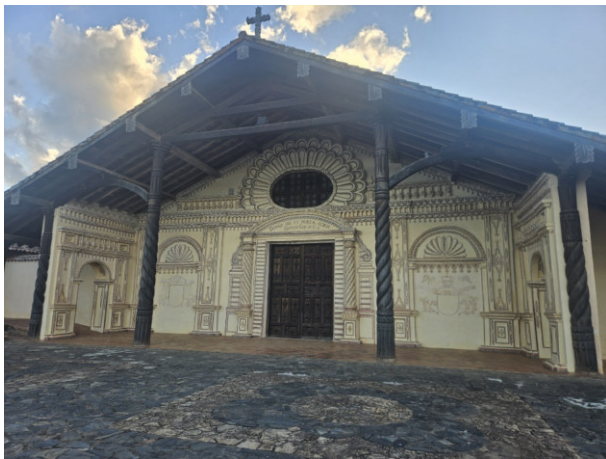
Fassade Kathedrale von San Javier