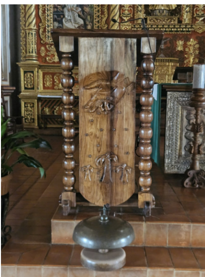
Ambo in Concepción