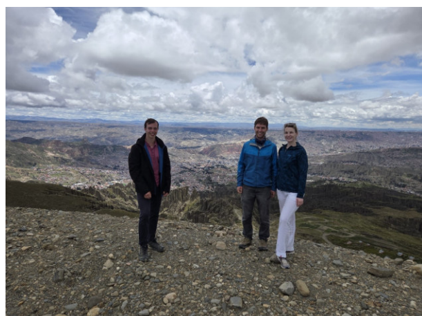
Aussichtspunkt auf über 4000 Metern