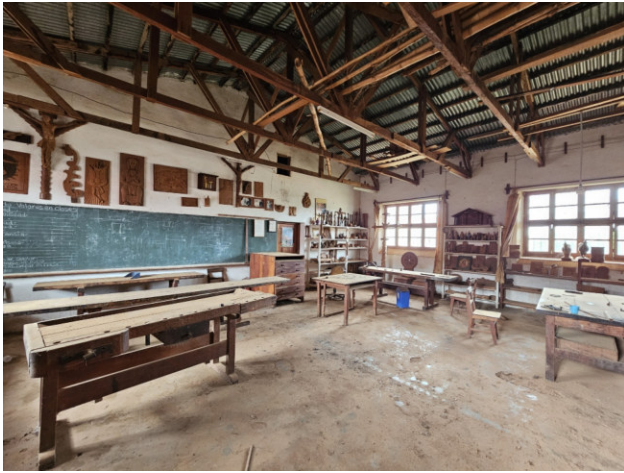
Bankraum der Lehrwerkstatt. Teil des Klosters in Concepción