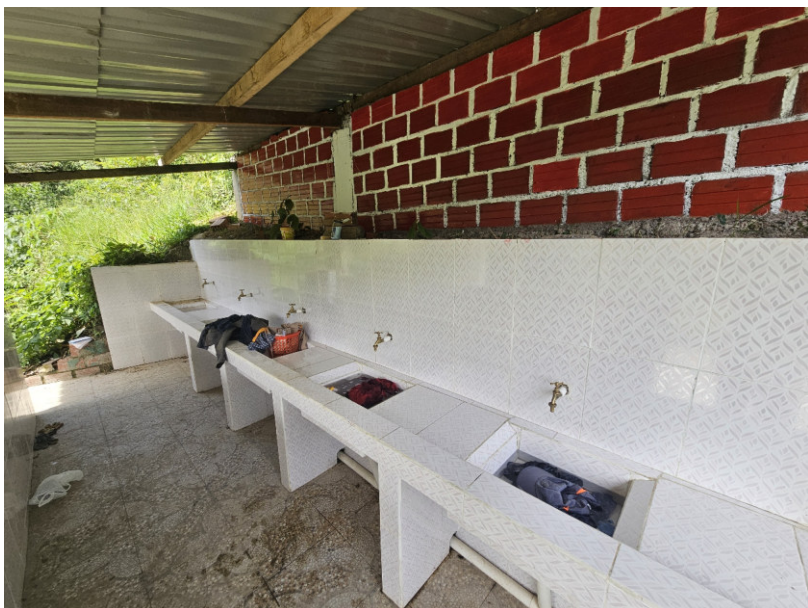
Waschunterstand neu gefliest und neuer Wasserzu- sowie abfluss

Im Internat haben wir einige Renovierungen und kleine Erweiterungen vorgenommen um das Gebäude für die nächste Zeit in Schuss zu halten. Wir haben einen Unterstand zum Waschen fertiggestellt und die dazu nötige Zu- und Ableitung von Wasser installiert. Da der alte Wassertank hierfür Löcher hatte und zu klein war, um die Wasserversorgung für sieben Waschbecken und den ebenfalls angeschlossenen Schweinestall zu puffern, haben wir ihn durch einen neuen ersetzt.