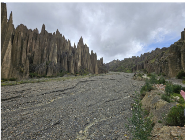
Valle de las Ánimas