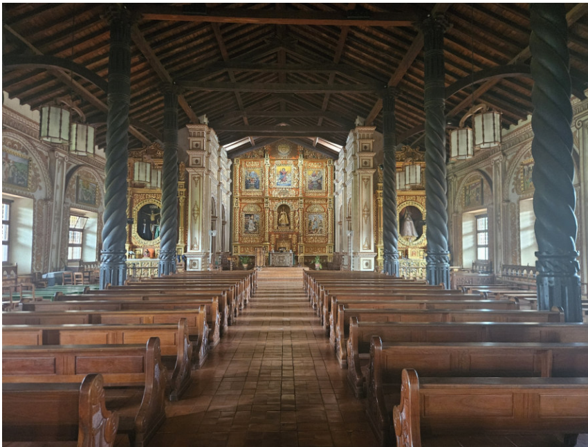
Innenansicht Kathedrale Concepción