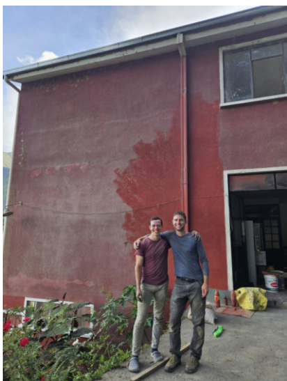
Malerarbeiten am Internat

Als diese Arbeiten abgeschlossen waren haben wir das Internat neu gestrichen. Ein Teil der Innenwände und die Fassade haben einen neuen Anstrich in verschiedenen Farben erhalten. Dabei haben alle Angestellten des Internats und wir Freiwillige mit angepackt und auch padre Israel und Daniel aus der Pfarrei Coroico haben mehrere Tage mitgeholfen.