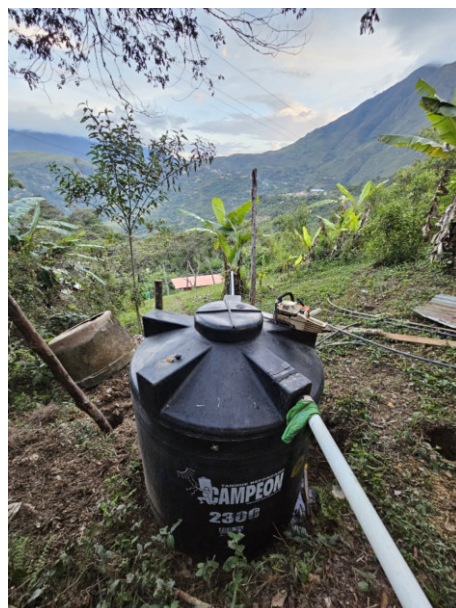
Neuer Wassertank aus Kunststoff. Zuleitung aus Bach

Als diese Arbeiten abgeschlossen waren haben wir das Internat neu gestrichen. Ein Teil der Innenwände und die Fassade haben einen neuen Anstrich in verschiedenen Farben erhalten. Dabei haben alle Angestellten des Internats und wir Freiwillige mit angepackt und auch padre Israel und Daniel aus der Pfarrei Coroico haben mehrere Tage mitgeholfen.