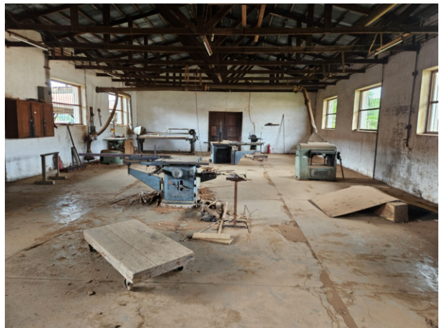
Maschinenraum der Lehrwerkstatt. Einige deutsche Maschinen wurden eingeschiff

Dannach haben wir uns mit 16 anderen Freiwilligen aus Deutschland in Santa Cruz zum Zwischenseminar getroffen. Wir haben Probleme in den Projekten besprochen und uns auf das zweite halbe Jahr vorbereitet. Aber am wichtigsten war mir der Austausch mit den anderen Freiwilligen und die Vernetzung. Bei gemeinsamen Ausflügen und geselligen Abenden kam das definitiv nicht zu kurz.