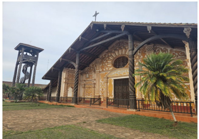
Fassade Kathedrale mit Glockenturm von Concepción