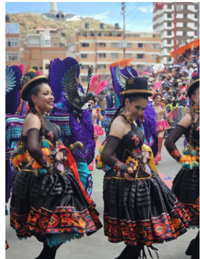
Carnaval von Oruro