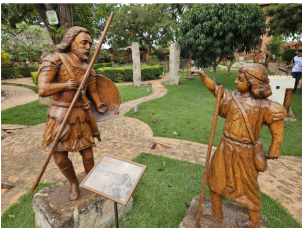
David und Goliath im biblischen Garten