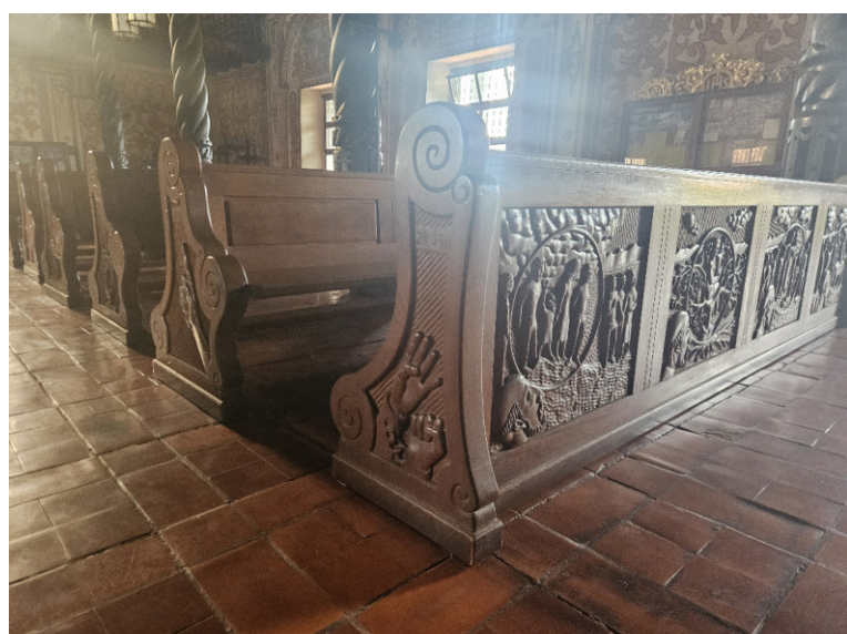
unterschiedliche Schnitzereien an allen Bänken der Kathedrale in Concepción