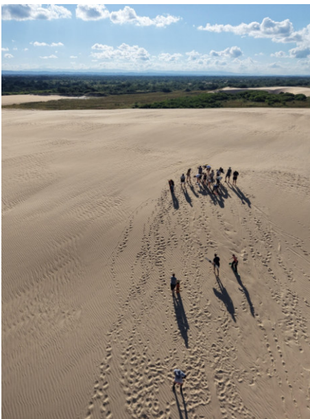
Sandsurfing in den "Lomas de Arena"

Dannach haben wir uns mit 16 anderen Freiwilligen aus Deutschland in Santa Cruz zum Zwischenseminar getroffen. Wir haben Probleme in den Projekten besprochen und uns auf das zweite halbe Jahr vorbereitet. Aber am wichtigsten war mir der Austausch mit den anderen Freiwilligen und die Vernetzung. Bei gemeinsamen Ausflügen und geselligen Abenden kam das definitiv nicht zu kurz.